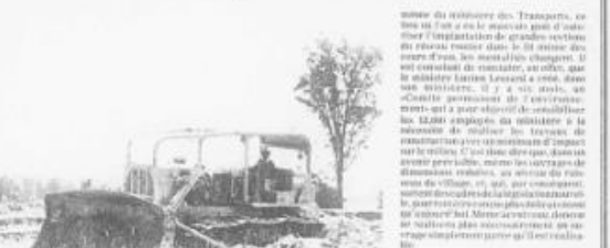
Le plus en plus, il faut tenir compte de la qualité de la vie, quand on crée des habitations et autres œuvres humaines.