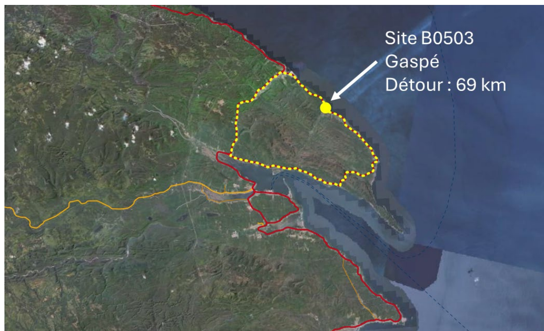
Figure 2. Illustration du chemin de détour de 69 km (pointillé jaune) pour le site B0503, dans la municipalité de Gaspé.

Je vous prie d'agréer, Madame, l'expression de mes sentiments les meilleurs.