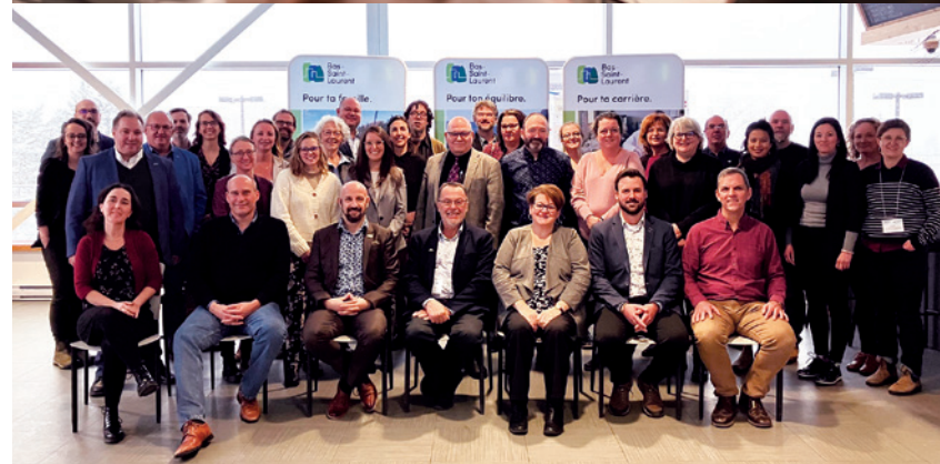
Forum des partenaires du développement régional, juin 2022 et novembre 2022