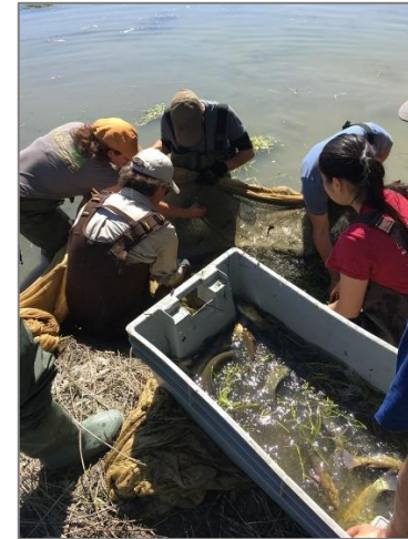
7) Tri des espèces et dénombrement des poissons capturés