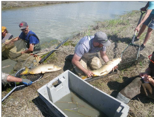
5) Sortie des grands spécimens et mesure de la longueur totale. Transport vers le cours d'eau adjacent avec une paise