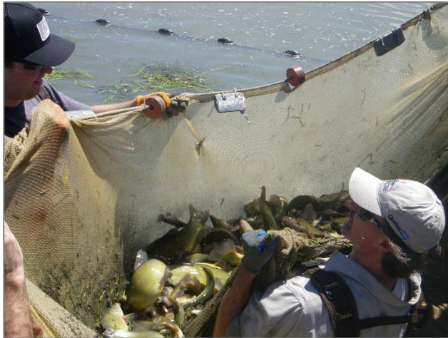
5) Sortie des grands spécimens et mesure de la longueur totale. Transport vers le cours d'eau adjacent avec une paise