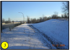
Puit de regard au nord du fossé MTQ