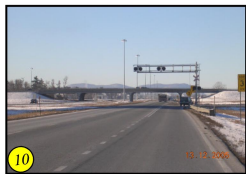
Traverse d'une voie ferrée et viaduc de l'échangeur 130