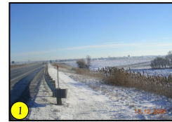
Traversée d'un cours d'eau