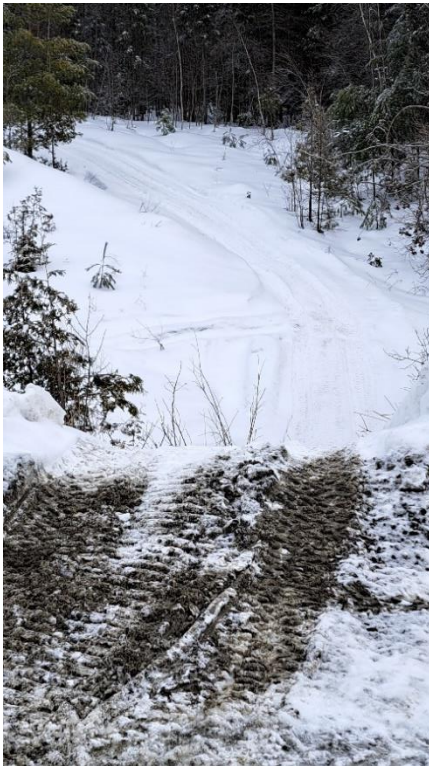
Chemin Bûcherons - Courbe à 90 degrés avec devers non conforme et visibilité très réduite

Durant la saison hivernale, les motoneiges et les VTT circulent fréquemment sur le chemin des Bûcherons et sur le chemin de la Rive. Cela augmente l'achalandage sur ces chemins et les risques de collision avec les automobiles. De plus, ces motoneigistes et les conducteurs de VTT utilisent actuellement le parc et ses sentiers pour leur bon plaisir comme en témoigne la photo ci-jointe, et ce, sans précaution pour l'environnement.