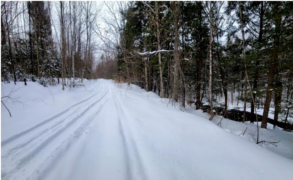
Photo 4. L'actuel chemin forestier passe à quelques mètres de la gorge du ruisseau Ély. Le dénivelé entre le chemin et le ruisseau est important à cet endroit.

Cette route passerait également à une vingtaine de mètres de la gorge du ruisseau Ély. Le dénivelé est important à cet endroit. La construction de la route ainsi que l'installation potentielle d'une glissière de sécurité viendraient dénaturer cet espace, qui constitue à mon avis un des attraits de l'agrandissement. Il y a également la possibilité que des visiteurs s'arrêtent et se stationnent en bordure de route pour accéder facilement à ce lieu, créant ainsi des enjeux pour les usagers de la route.