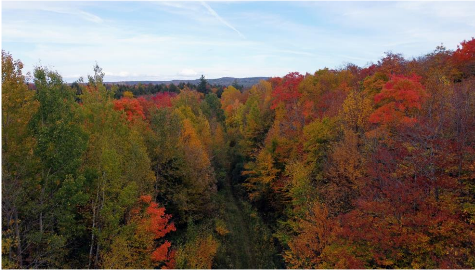
Photo 3. Le chemin forestier.