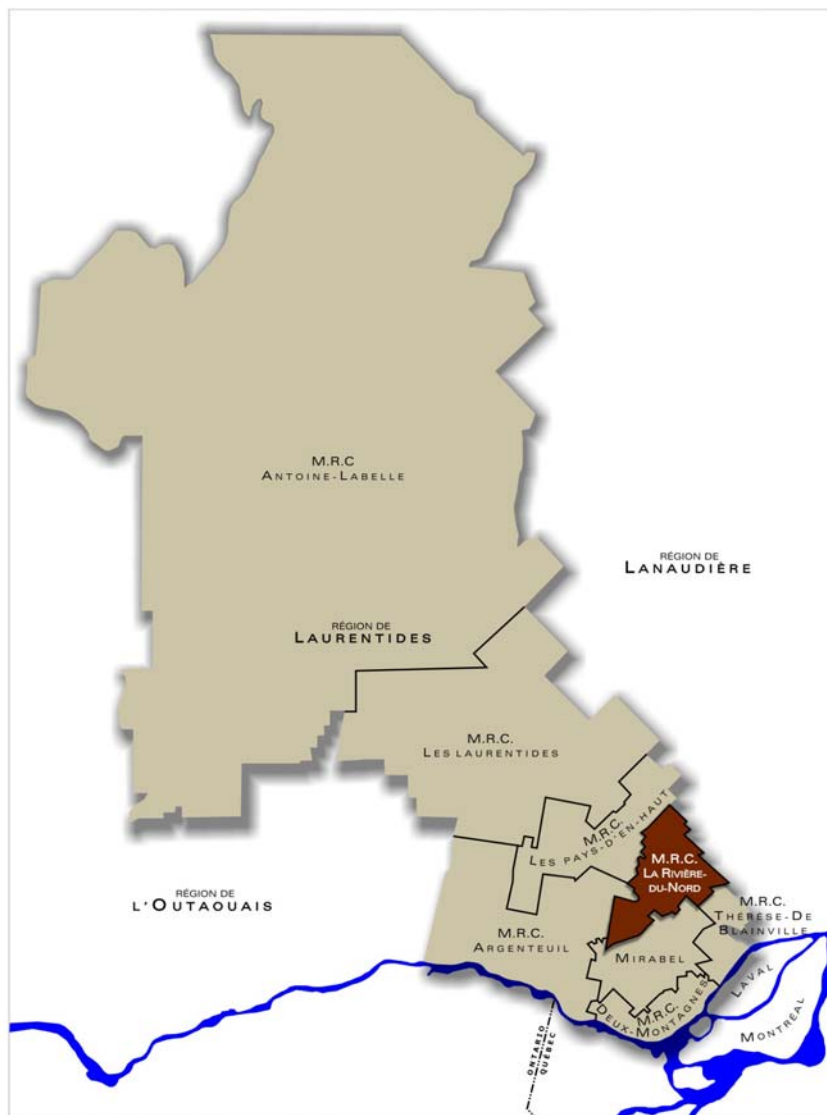
Figure 2-2 - Territoire de la région administrative des Laurentides

Tel qu'illustré à la figure 2-2 , la région administrative des Laurentides regroupe huit municipalités régionales de comté (MRC) cumulant 72 municipalités locales. Cette section précise le contexte régional dans lequel s'insère la MRC.