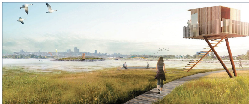
Photo 4 : Plan-image de la phase 4 de la Promenade Samuel-de-Champlain présentée par CCNQ en 2015

d'Orléans va durer 100 ans, nous estimons qu'il faudrait tenir compte des concepts avancés pour se projeter dans le futur et harmoniser tous les aménagements. Nous espérons que le promoteur puisse analyser ces concepts développés pour le littoral est, afin de les intégrer le plus possible dans sa réflexion pour la conception finale des aménagements prévus aux abords du nouveau pont.