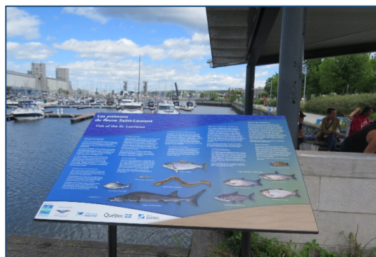
Photos 8 et 9 : Une partie des panneaux d'interprétation réalisés par ZIPQCA sur la biodiversité du St-Laurent