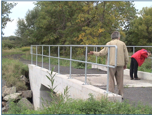
Photo 6 : Passe pour les poissons et les piétons au Parc Riverain des Beaux-Près à Château-Richer

aménagé une passe pour les poissons qui peuvent circuler du fleuve vers l'étang favorisant ainsi la création d'une aire d'alevinage et qui sert aussi de petit pont pour le passage des visiteurs et piétons.