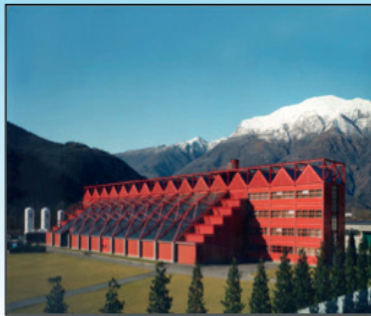
Usine de démonstration