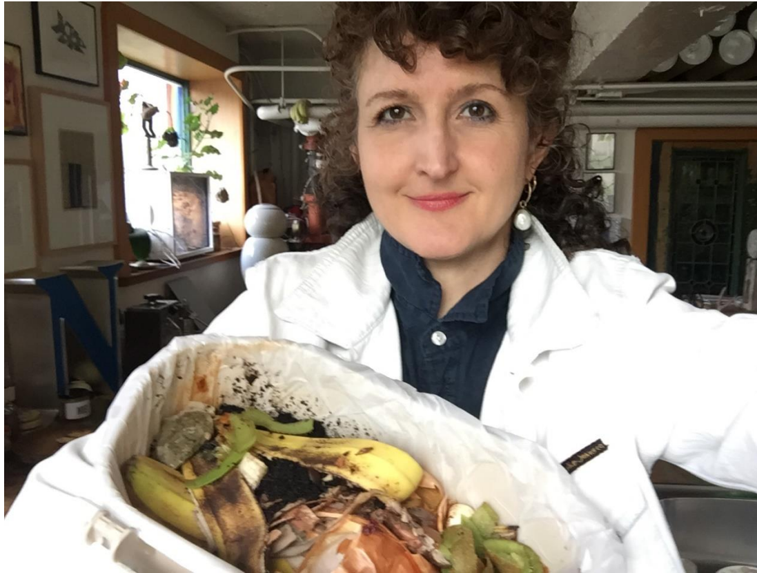
Autoportrait avec compost

Le travail est le nôtre, nous ne pouvons plus léguer nos problèmes aux générations futures.