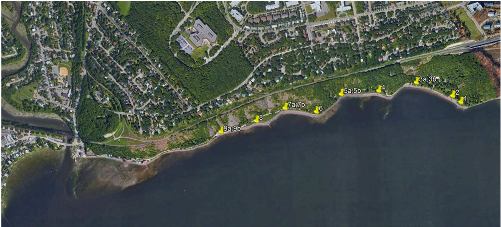
Emplacements des échantillons 1 à 9 situés le long de la Plage-Jacques-Cartier