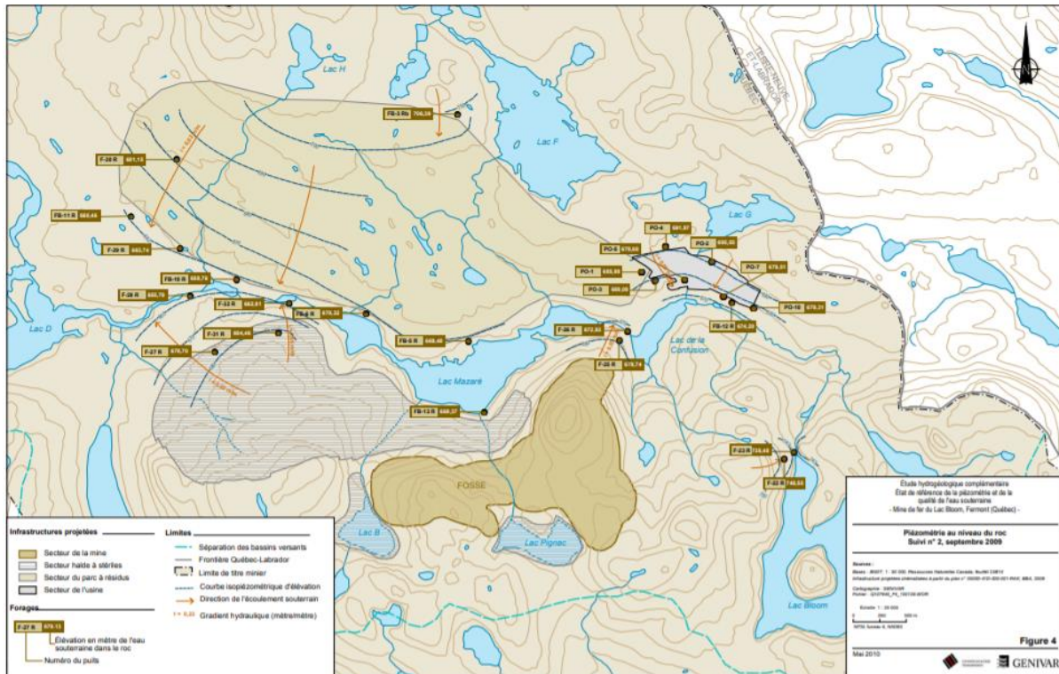
Schéma 2 - Écoulement souterrain (2010)

Toujours lors de l'étude hydrogéologique effectuée en 2010, Genivar a déterminé que l'écoulement souterrain se dirige vers le lac D et le lac Mazaré. La direction de l'écoulement s'effectue vers le sud dans le secteur du parc à résidus. Malgré le manque de données, selon Genivar, la direction de l'écoulement de l'eau souterraine dans le secteur de l'usine semble s'effectuer vers le sud, donc vers le lac de la Confusion. Alors que la direction de l'écoulement souterrain s'effectue vers le nord dans le secteur de la halde à stériles. (Genivar, 2010)