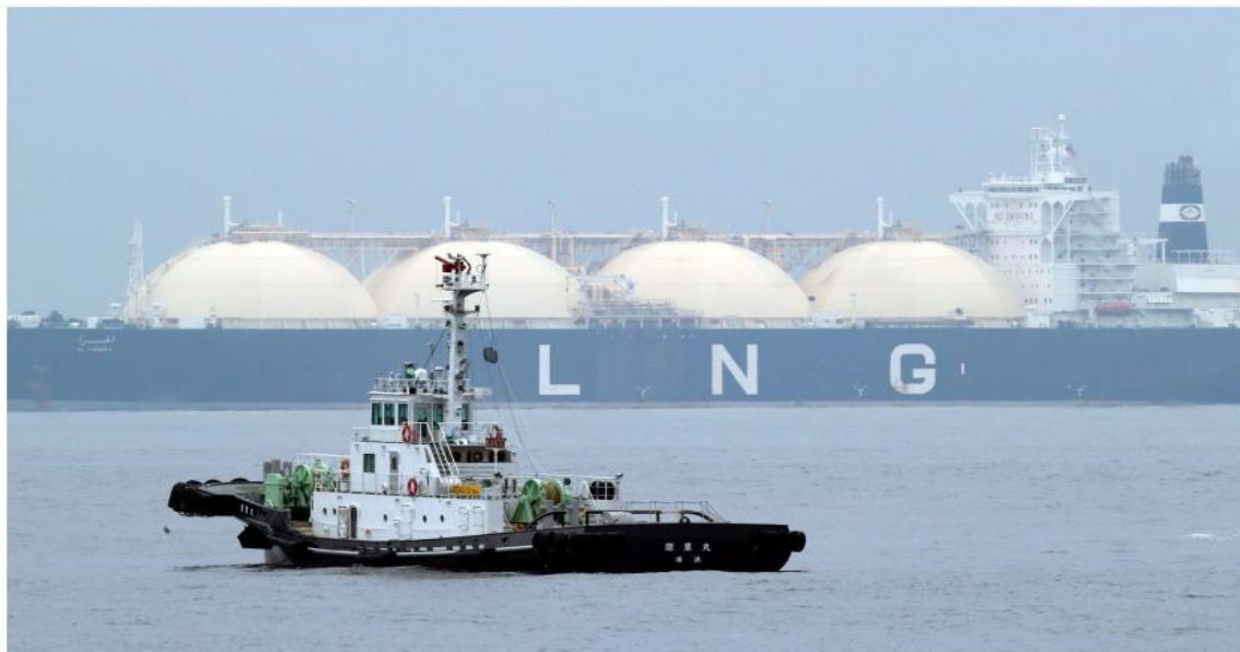
Le gaz naturel liquéfié serait exporté par des méthanières empruntant le Saguenay et le Saint-Laurent.

Il existe déjà au Saguenay-Lac-Saint-Jean des industries bien en place, comme l'industrie de l'aluminium. L'industrie touristique avec l'arrivée massive de croisiéristes est en plein essor aussi. C'est sur ce type d'industries existantes qui participent à la prospérité économique de la région qu'il faut miser, plutôt que sur le développement de nouvelles infrastructures très coûteuses polluantes et non durables.