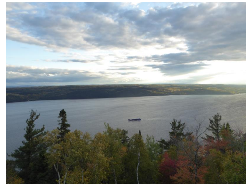
Vue depuis la Pourvoirie du Cap au leste