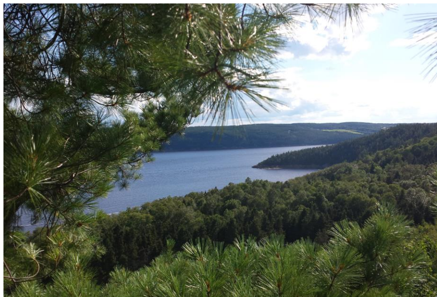
Vue depuis le parcours de « Fjord en arbres » du Parc aventure Cap Jaseux