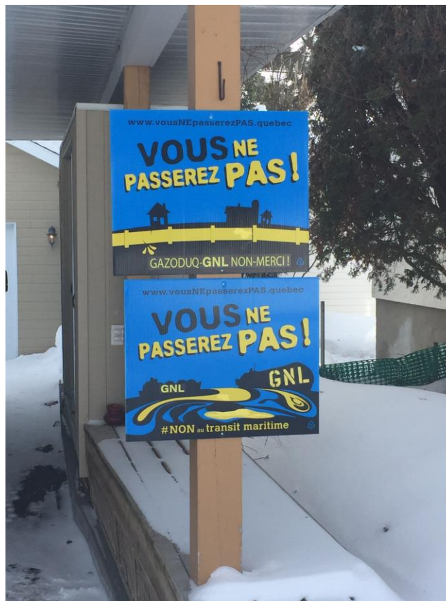
Affichage de l'opposition du projet sur des terrains privés.