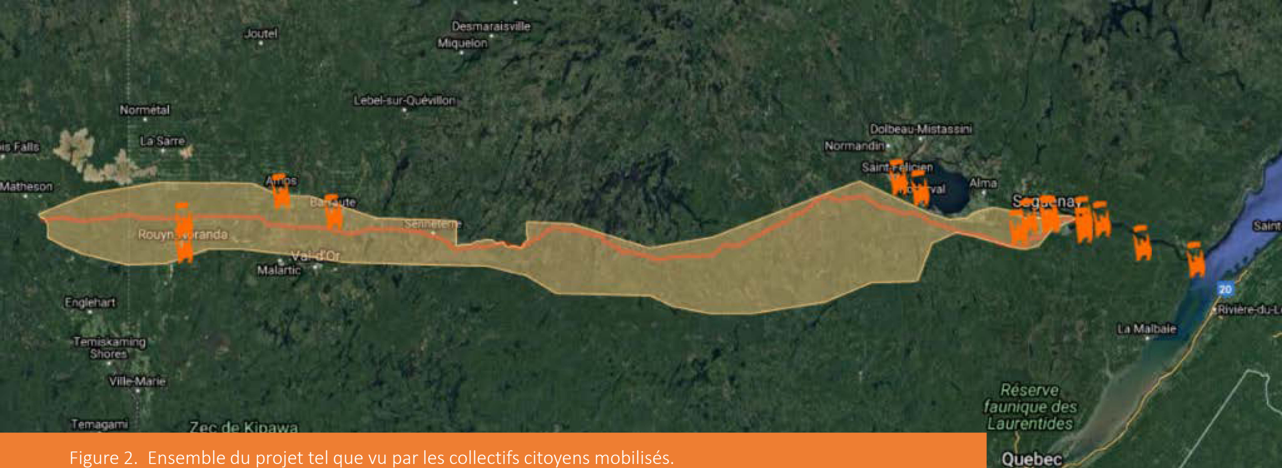
Figure 2. Ensemble du projet tel que vu par les collectifs citoyens mobilisés.