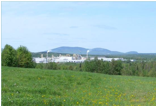
Grand bâtiment industriel contrastant

Généralement, il s'agit d'éléments ponctuels, disséminés sur le territoire et rattachés au cœur d'un village. Les principaux ensembles se trouvent au cœur de la ville de Lac-Mégantic, à Saint-Ludger, à Courcelles et Piopolis.