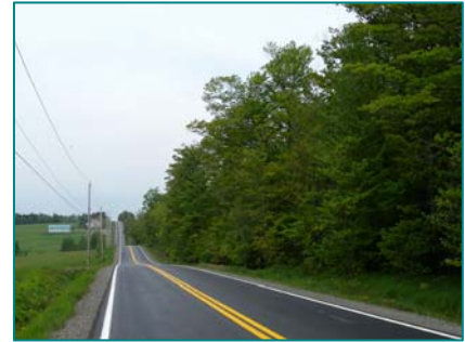
Route qui ondule dans la campagne de Piopolis

Route des Sommets (route 263) et parcours alternatif : axe touristique reconnu.