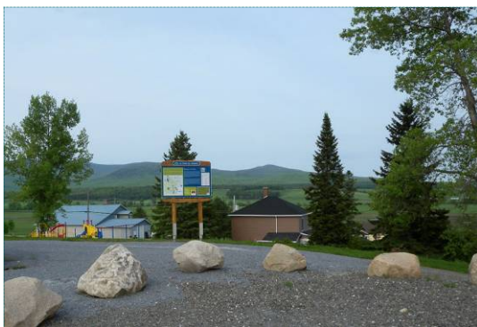
Halte à La Patrie