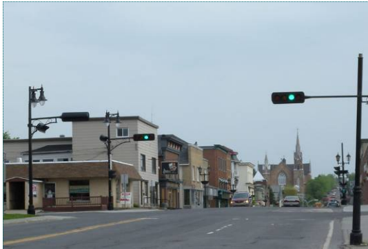
Centre-ville de Lac-Mégantic

L'histoire de l'occupation de la région de Mégantic se lit à travers plusieurs témoins des héritages amérindiens, irlandais, écossais, anglais et canadien-français. Cette histoire s'inscrit dans la richesse des noms et toponymes de la région. Plusieurs types de patrimoine peuvent être appréciés dans la région : religieux (église, presbytère, cimetière), institutionnel (couvent), résidentiel, commercial, ferroviaire (gare, tronçon de voie ferrée, pont), commémoratif (site relié à un personnage), archéologique (site relié à la présence autochtone).