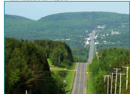
Vue du village de Notre-Dame-des-Bois avec l'arrière plan forestier des collines