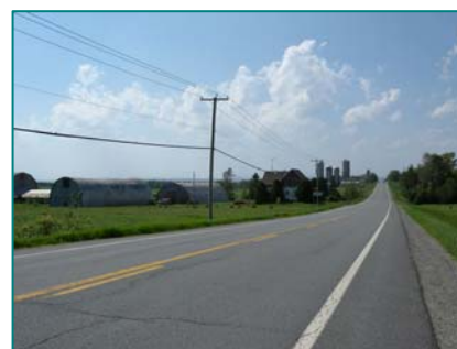
Paysage agricole dans Stornoway