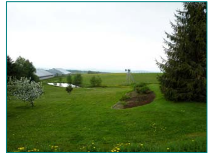
Vallée du côté ouest du mont Mégantic

Route des Sommets : route 212 : axe touristique reconnu.