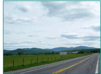
Arrière-plan des Montagnes Blanches à partir de la plaine de Saint-Augustin-de-Woburn

Territoire de chasse et de pêche du secteur Louise de la ZEC Louise-Gosford.