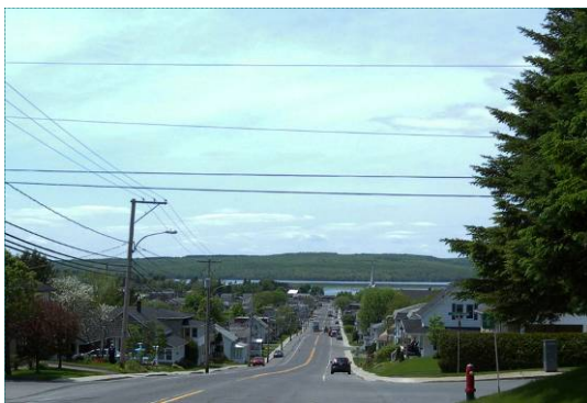
Centre de Lac-Mégantic