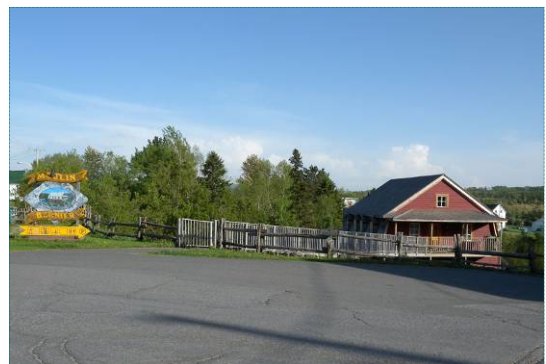
Moulin Bernier à Courcelles