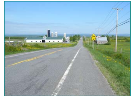
Grande ferme à Lambton

Patrimoine religieux (église, presbytère, cimetière) de Lambton, patrimoine industriel du moulin Bernier et ferroviaire de l'ancienne voie du Québec Central, patrimoine résidentiel pionnier à Courcelles et Saint-Sébastien. Route des Sommets : routes 108 et 204, une route touristique reconnue. Corridor vert cyclable de l'ancienne voie ferrée par Courcelles (lien Beauce/Lac-Mégantic).