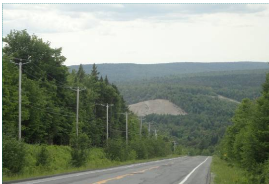
Sablière à Marston

Deux gravières/sablières marquent le paysage : l'une située près de l'entrée ouest à Lac-Mégantic par la Route 204 et l'autre à Marston, particulièrement visible en provenance de Piopolis.