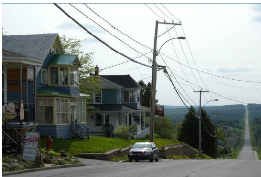
Village de Notre-Dame-des-Bois