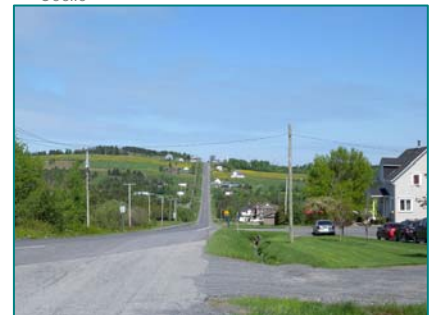
Petites implantations rurales à Saint-Sébastien