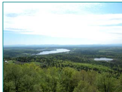
Paysage forestier et le lac Drolet à partir de la Maison du Granit

Patrimoines religieux en granit à Lac-Drolet et Sainte-Cécile-de-Whitton, patrimoine architectural résidentiel à Lac-Drolet. Centre du village de Saint-Ludger. Patrimoine religieux, ferroviaire (gare), architectural à Lac-Mégantic. Route des Sommets : routes 108, 204, 161, 263 : route touristique reconnue. Corridor Chaudière-Kennebec : axe touristique. Sentiers à la Maison du Granit et au mont Morne. Église de Marston transformée en théâtre.