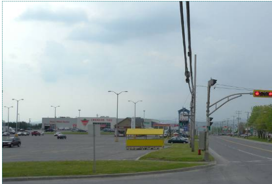
Zone commerciale à l'entrée de Lac-Mégantic