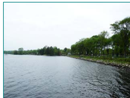
Parc des Vétérans au bord du lac Mégantic

Parcours alternatif de la Route des Sommets : portion de la route 161 : axe touristique reconnu. Corridor Chaudière-Kennebec.