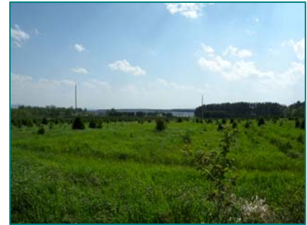
Plantation de sapins de Noël au bord du lac Aylmer

Lacs Aylmer et Saint-François comme plan d'eau pour les activités nautiques et de pêche et cadre de villégiature. Sites archéologiques associés à la fréquentation amérindienne du territoire.