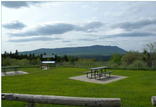
Halte à Notre-Dame-des-Bois