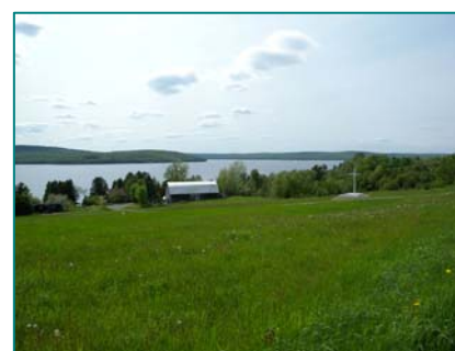
Enclave agricole au sud-est du lac Mégantic