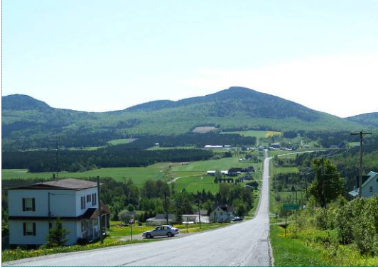
Paysages agroforestiers dans Saint-Sébastien

Cette partie du haut-plateau appalachien se subdivise en neuf unités de paysage. Quatre unités correspondent à des plateaux c'est-à-dire à des portions de territoire au relief de grande amplitude horizontale en position surélevée par rapport aux unités avoisinantes. Il s'agit des plateaux de Lambton, de la haute Chaudière, d'Audet et de La Patrie. Dans la partie ouest du territoire d'étude, le relief s'accroît pour former les basses collines de Piopolis et les buttes de Stornoway alors qu'émerge l'unité du mont Mégantic. Deux unités contrastent par leur étendue plus plane ou de forme concave avec la plaine du lac Mégantic et la vallée de la haute rivière au Saumon.