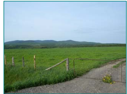
Vue du versant ouest du mont Mégantic de la route 257

Malgré l'étendue de la forêt, les versants du mont, visibles sur de longues distances et perceptibles depuis plusieurs points de vue sont très sensibles aux nouvelles insertions.