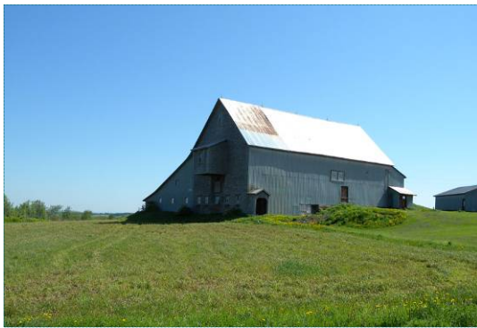
Grange en bardeau de cèdre avec encorbellement