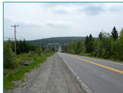
Fermeture du paysage dans la vue vers le village de Milan

Cimetière et parc commémorant un personnage légendaire à Milan. Moulin à farine Legendre à Stornoway. Sentiers du Marais Maskinongé. Forêt habitée de Saint-Romain. Route des Sommets : portions des routes 108 et 161.