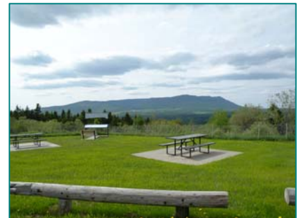
Vue du mont Mégantic à partir de la halte à Notre-Dame-des-Bois