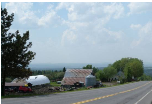
Zone d'entreposage négligée

Les terres en friche sont souvent mal perçues, jugées inesthétiques dans le paysage et traduisent des milieux en déclin. La MRC du Granit a déjà répertorié des centaines d'acres d'anciennes prairies agricoles abandonnées 3 . La déprise agricole est aussi perceptible par l'abandon de l'entretien des granges, noté de manière diffuse sur le territoire.