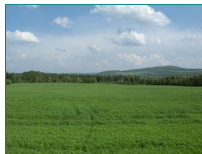
Vue vers le mont Aylmer dans Stratford