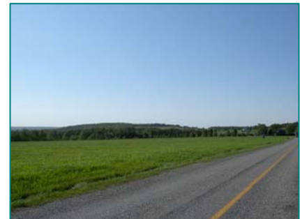
Doux vallons cultivés