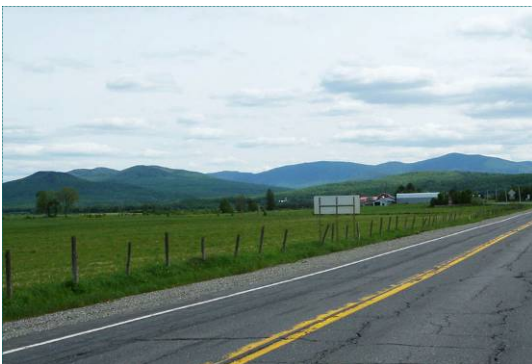
Vue des Montagnes Blanches

La portion de la région naturelle des Montagnes Blanches, comprise dans la zone d'étude, chevauche un seul ensemble physiographique, celui des hautes collines du Mont-Gosford, qui se prolonge au delà de la frontière avec les États-Unis. À son tour, cet ensemble se fractionne en trois unités de paysage : les collines du Porc-Épic, le mont Flat Top et le Mont-Gosford.