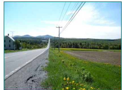
Vue éloignée des monts Morne et Sainte-Cécile