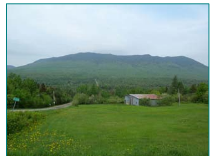
Vue du versant est du mont Mégantic