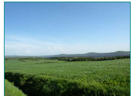
Grand lac Saint-François