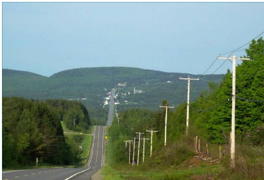
Route qui ondule vers Notre-Dame-des-Bois, un village en hauteur