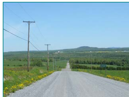
Paysage agroforestier à Saint-Robert

Les masses boisées et le relief vallonné facilitent l'intégration de nouveaux éléments sous certaines conditions. En effet, la configuration de haut-plateau donne une position surélevée à l'observateur, renforcée par l'ouverture des champs cultivés et les longues perspectives des routes sur les versants éloignés. La frange de l'unité donnant sur le lac Mégantic largement perceptible correspond aux versants les plus sensibles à de nouvelles insertions.