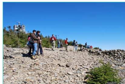
Tour d'observation au sommet du mont Gosford (CLD de la MRC du Granit)

Avant-projet de réserve écologique à la Montagne de Marbre : présence d'écosystèmes fragiles, intérêt ornithologique (aigle), géologie particulière et site archéologique.