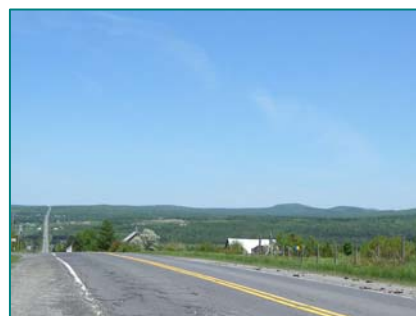
Aspect rectiligne de la route 204 et vue des sommets dans Frontenac