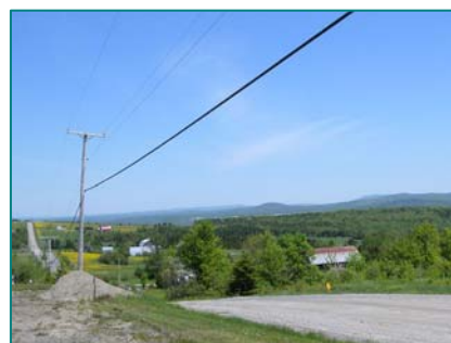
Ambiance rurale et vue vers les sommets de la route 204 à Audet