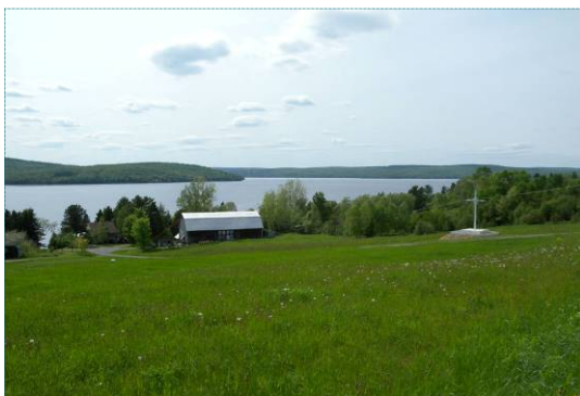
Importance du champ à l'avant-plan