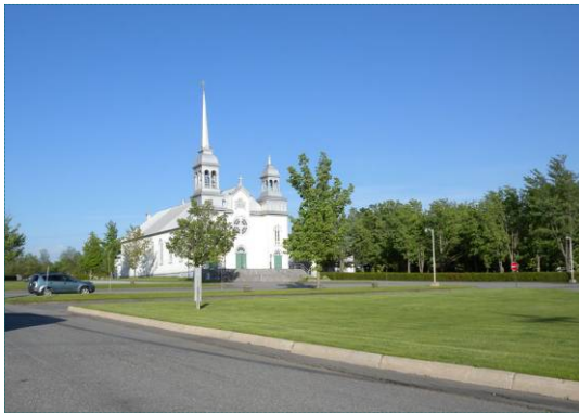
Village de Courcelles