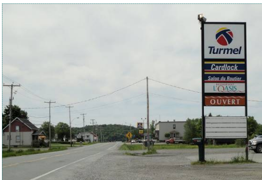
Intersection à Courcelles

Parmi les principales zones résidentielles mal intégrées, notons l'organisation compacte des bâtiments près de la rive à l'embouchure du Grand lac Saint-François et la zone des condominiums à Lac-Mégantic par le gabarit du bâtiment et sa couleur contrastante.