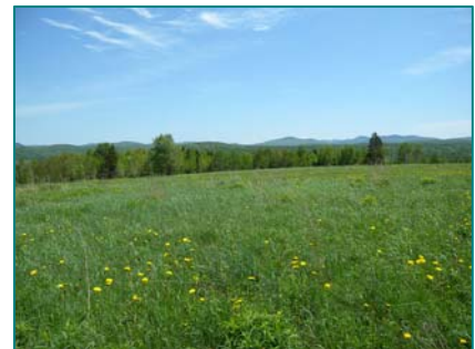
Vue des sommets à partir de la route 204