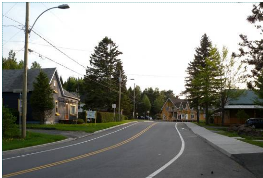
Village de Piopolis