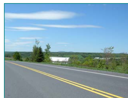
Paysage de la haute Chaudière près de Saint-Ludger