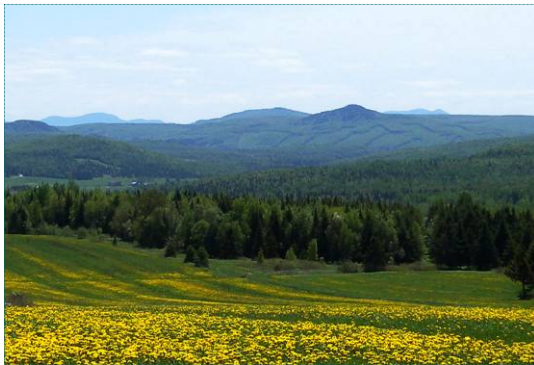
Parterre de coupes forestières au loin