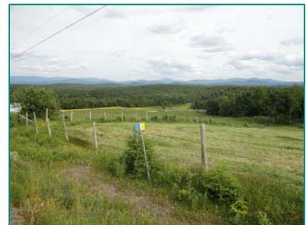
Vue panoramique vers les sommets à partir des hauteurs de Piopolis