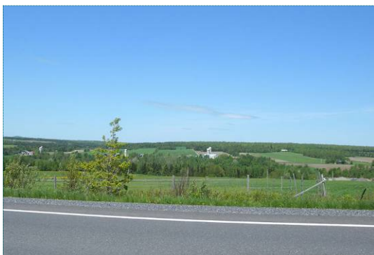
Fermes et boisés le long de la Chaudière