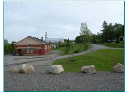
Localisation du village de La Patrie entre une vallée et un plateau

Route des Sommets : route 212 : axe touristique reconnu.