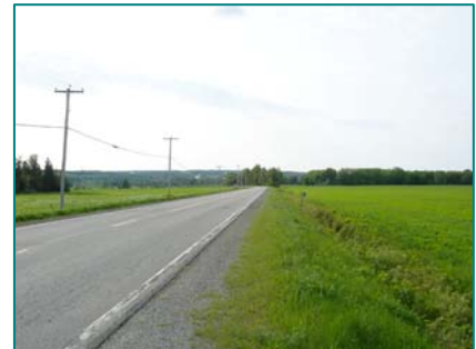
Étendue agricole vers le village de La Patrie