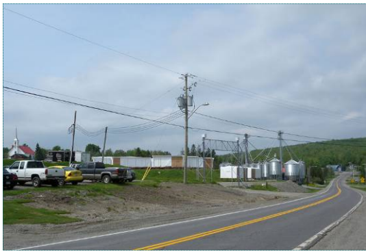
Industries à intégrer

Les parcs industriels souvent localisés à l'entrée de la ville et des villages ne facilitent pas la création d'entrées réussies et attrayantes. Des zones industrielles affectent l'entrée à La Patrie et à Lambton par des cours à bois non organisées, à Milan par deux industries fleurons de la région mais aux façades non aménagées et à Lac-Mégantic par la présence d'une industrie de grand gabarit d'une couleur qui contraste fortement dans le paysage.