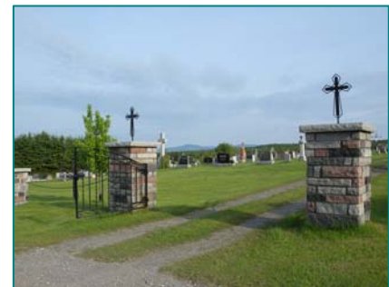
Cimetière de La Patrie