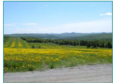
Vue des sommets dans la municipalité de Saint-Robert

Vue de sommets à partir de la Route des Sommets.