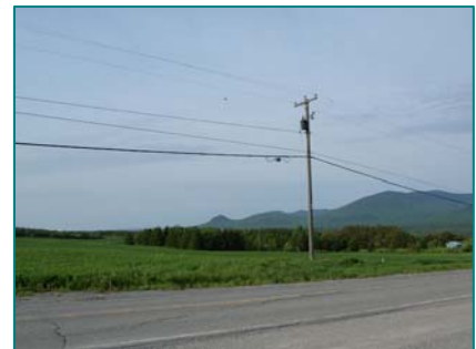
Partie du plateau à l'entrée ouest du village de La Patrie