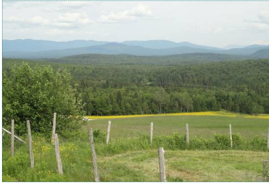
Point de vue d'intérêt sur les hauteurs de Piopolis