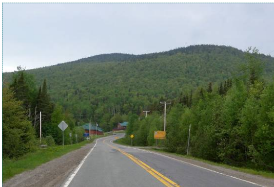
Entrée du parc du Mont-Mégantic

sur des hauteurs et les centres dans les vallées. Les villages des hauteurs, comme Lambton, Saint-Sébastien et Notre-Dame-des-Bois, créent une signature typique par des églises formant des repères clairs dans le paysage et par leur relation étroite avec la colline. Ils surplombent les environs et offrent des vues sur le paysage de la région. Les centres dans les vallées établissent un lien fort avec des cours d'eau, un lac ou une rivière, comme dans les cas du centre-ville de Lac-Mégantic, des villages de Lac-Drolet, Piopolis ou Saint-Ludger. Ces lieux offrent généralement peu de perspective visuelle sur l'extérieur. D'autres villages possèdent une localisation plus discrète comme La Patrie par une implantation à mi-hauteur.