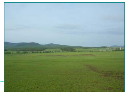
Grands champs au pied du mont Mégantic