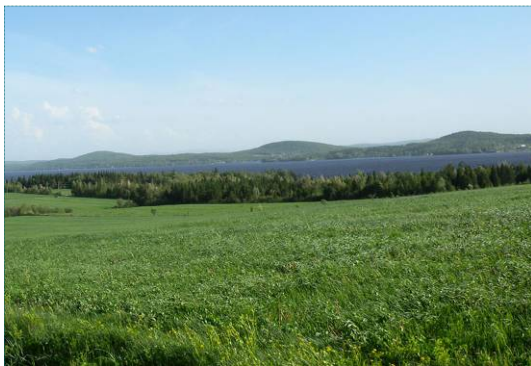
Champs près du grand lac Saint-François

À l'échelle plus détaillée du district écologique (niveau 4), le bas-plateau appalachien comprend deux unités de paysage : la vallée du lac Aylmer et la vallée du Grand lac Saint-François. Pour les fins de la présente étude, les parties de ces deux unités comprises dans le territoire d'étude ont été remembrées en une seule unité nommée Vallées du lac Aylmer et du Grand lac Saint-François.