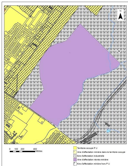
Avant la modification