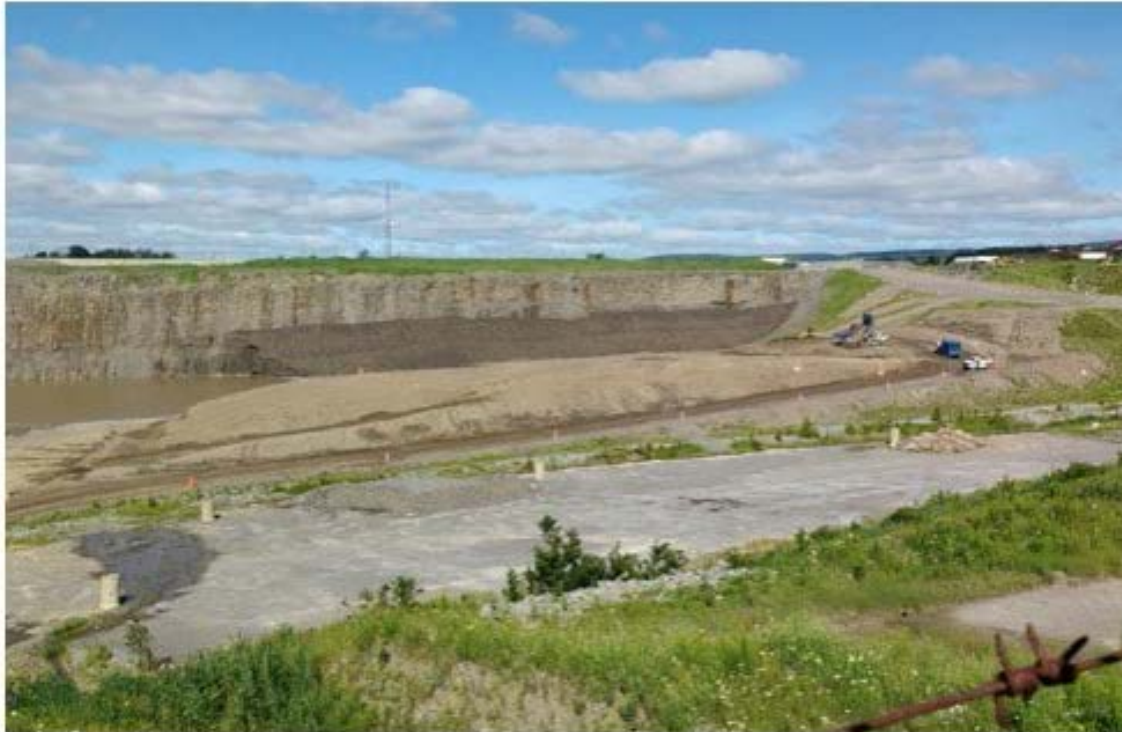
Dépôt à neige du boulevard Raymond