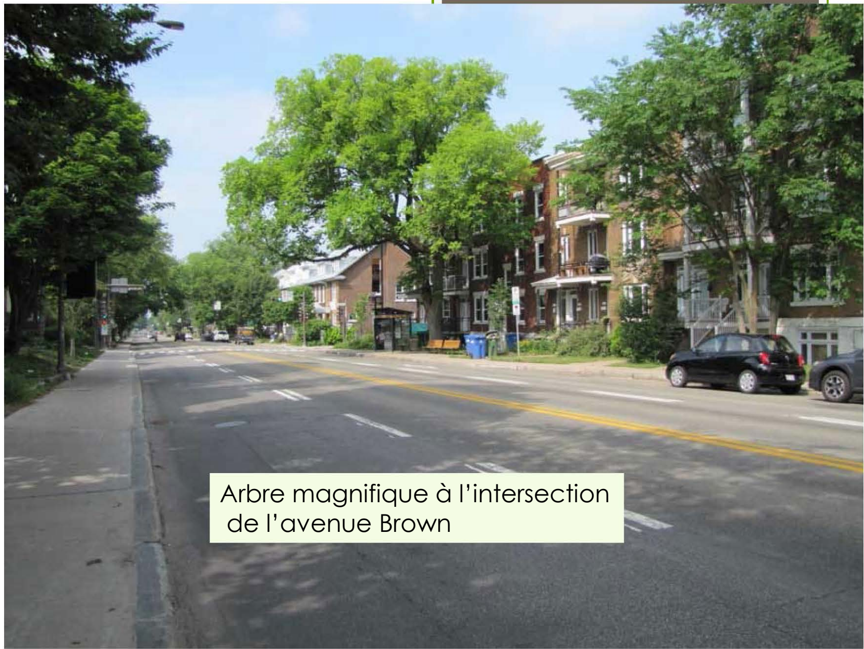
Arbre magnifique à l'intersection de l'avenue Brown