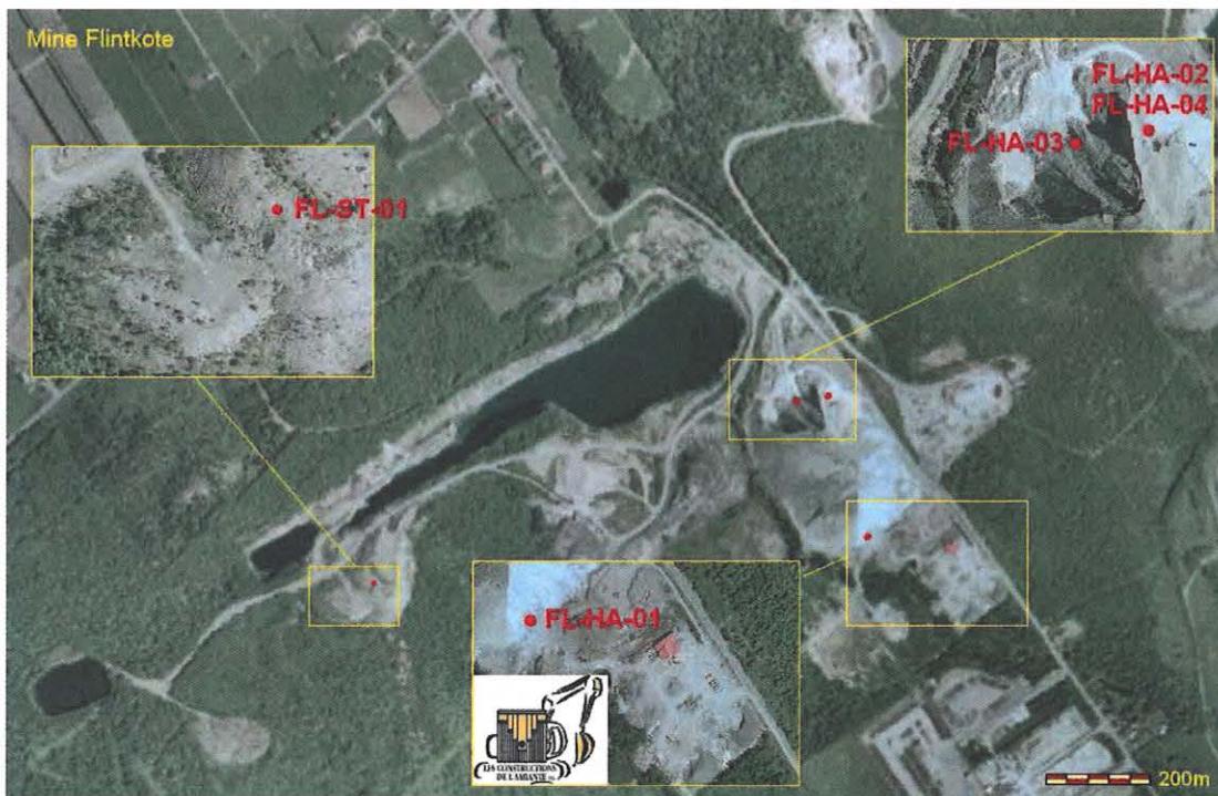
Figure 4.9 : Localisation des points de prélèvement sur le site de la mine Flintkote

Également, FL-ST-01 a été prélevé le 1 er août 2013 dans une des piles de stérile du secteur ouest du site minier Flintkote, afin de vérifier le contenu en fibres dans ce type de résidus. La granulométrie est très variée (de sable fin à des blocs métriques) et le contenu visuel en fibres surprenant. Plusieurs amas et veines de chrysotile ont été observés, dont des fibres de plus de 5 cm. Ces résidus appartiennent à Entreprise Sanifer Inc.