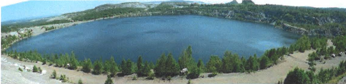
Figure 4.52 : Puits de la mine Normandie