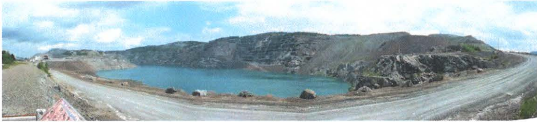
Figure 4.56 : Puits de la mine British Canadian