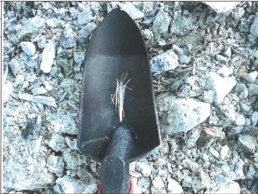
Photo no : P1040213.JPG Date : 2013-08-01 Description : Parmi tous les échantillonnages faits, c'est dans le parc à stériles de Flintkote que la fibre la plus longue a été constatée. En effet, ce matériel n'étant pas passé dans le moulin, la fibre n'a pas été broyée et a donc conservée sa pleine longueur.