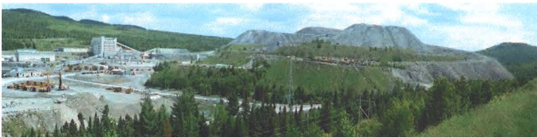
Figure 4.45 : Halde et bâtiments de la mine Lac d'Amiante

Le long de l'ancien tracé de la route 112, l'imposant parc à résidus se situe au sud de la mine et est estimé à plus de 120 Mt (Dupéré, Duplessis et Rousseau, 2007). La propriété appartient à LAB Chrysotile et Granilake exploite encore aujourd'hui les gisements de granite. Le site est donc accessible avec l'accord du propriétaire de Granilake.