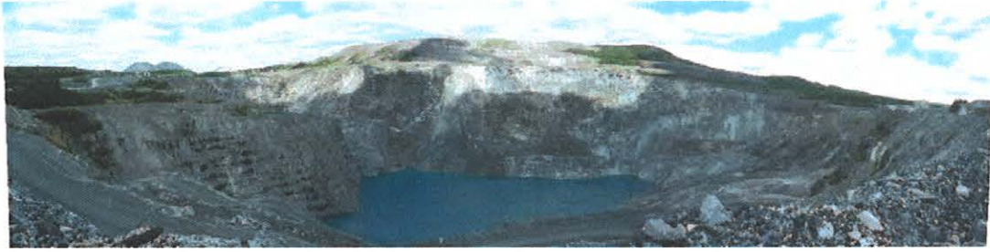
Figure 4.44 : Puits de la mine Lac d'Amiante