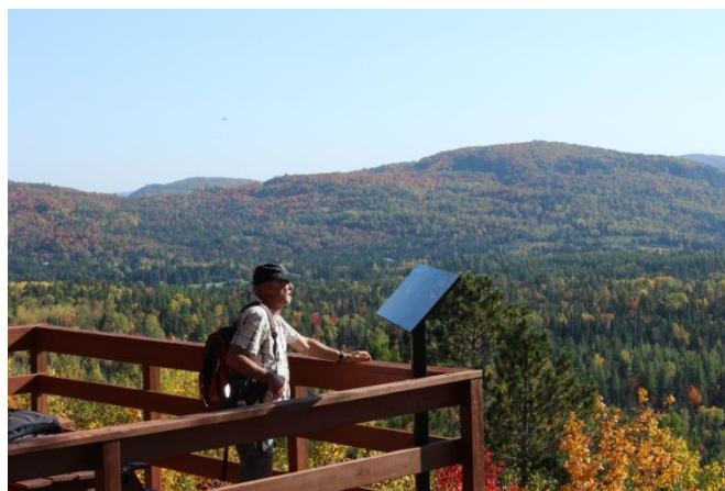
Belvédère près de la future grotte