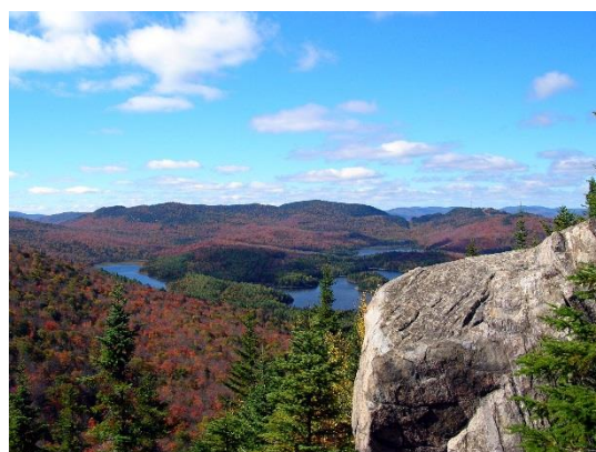
Sentier du Mont-Ouareau