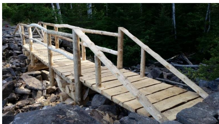
Passerelle du lac Kaël

Comme chaque année, la SDPRM a organisé une soirée, formule « 5 à 7 », pour remercier le travail colossal des bénévoles dans l'entretien du Sentier national. En 2018, la municipalité hôte fut Saint-Zénon. Cette soirée, toujours appréciée, permet d'échanger les bons coups et de fraterniser avec les bénévoles.