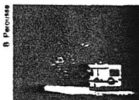
En mobile home sur les routes de l'Outaouais.

Dès la fin août, les escapades du week-end prennent les couleurs de l'automne. La flambée du feuillage, qui s'achève vers la fin octobre, est outre-Atlantique un extraordinaire spectacle. Dès ses premières lueurs, de nombreux festivals s'organisent dans les parcs. Au programme, un grand