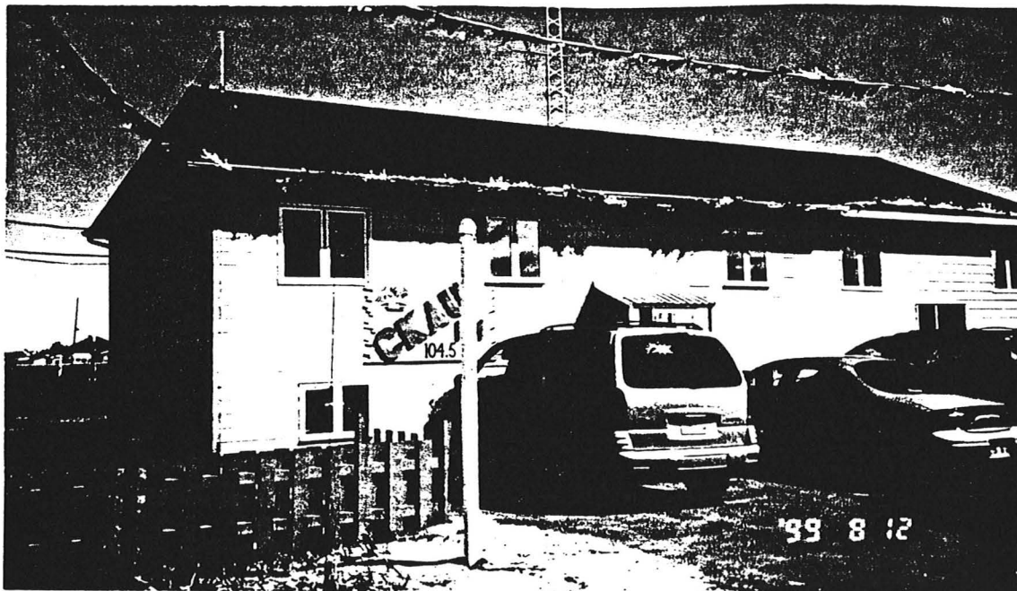
Bâtiment de la radio communautaire de Uashat mak Mani-Utenam situé à Maliotenam.