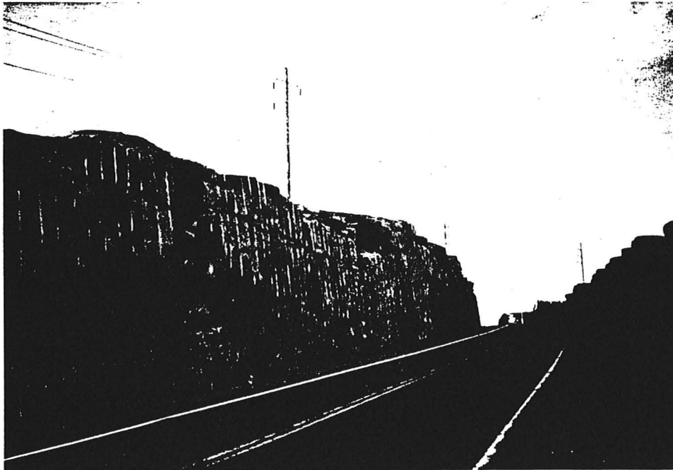
Nouvelle route d'accès reliant la route 148 entre Sept-Îles et Port-Cartier à la centrale SM-3.