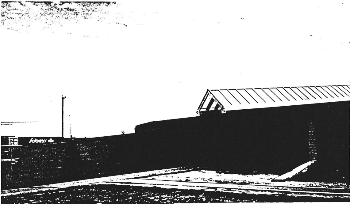
Nouveau musée Shaputuan de transmission de la culture montagnaise situé sur le terrain des Galeries montagnaises à Uashat. À l'arrière plan, le nouveau centre d'achat Sobey's appartenant au Conseil de bande.