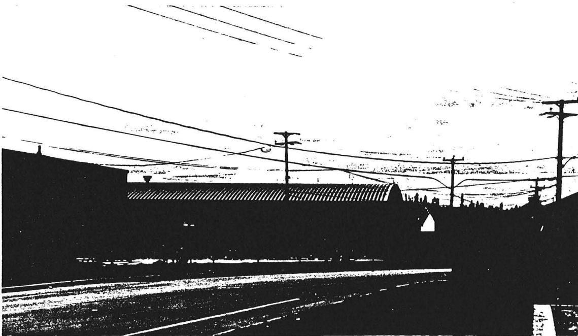
Nouvel aréna communautaire à Maliotenam construite à la suite de l'Entente Uashat Mak Mani-Utenam-Hydro-Québec (1994).