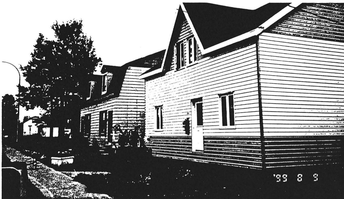
Maisons familiales construites avec vue sur le fleuve à Uashat, à proximité du centre-ville de Sept-Îles