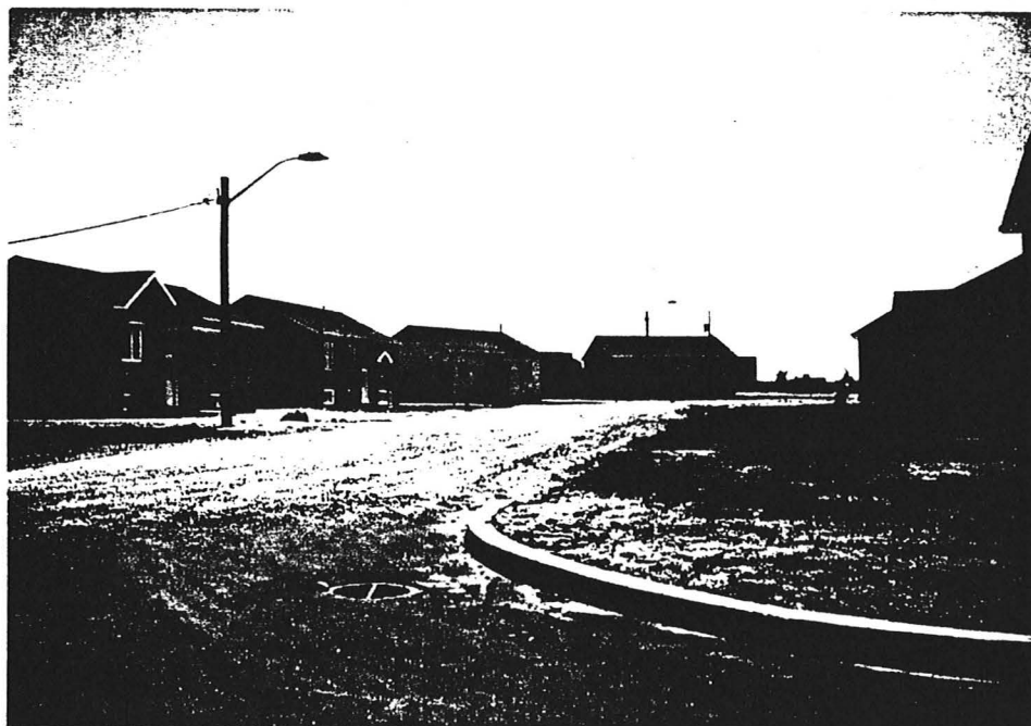
Nouveaux développements résidentiels situés à Uashat, dans la Communauté montagnaise de Uashat mak Mani-Utenam