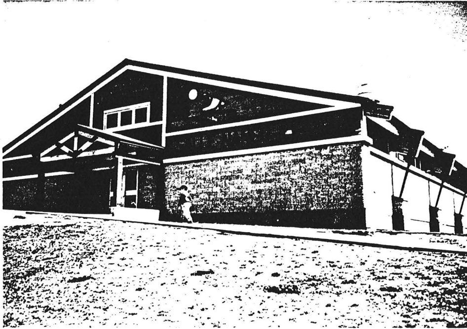
Salle Naneu - École primaire de la Communauté montagnaise de Uashat mak Mani-Utenam, située à Uashat.