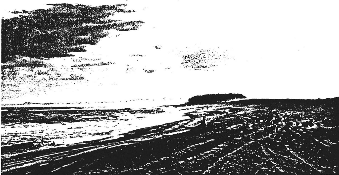
Plages en bordure du fleuve, situées à l'embouchure de la rivière Moisie, à Maliotenam