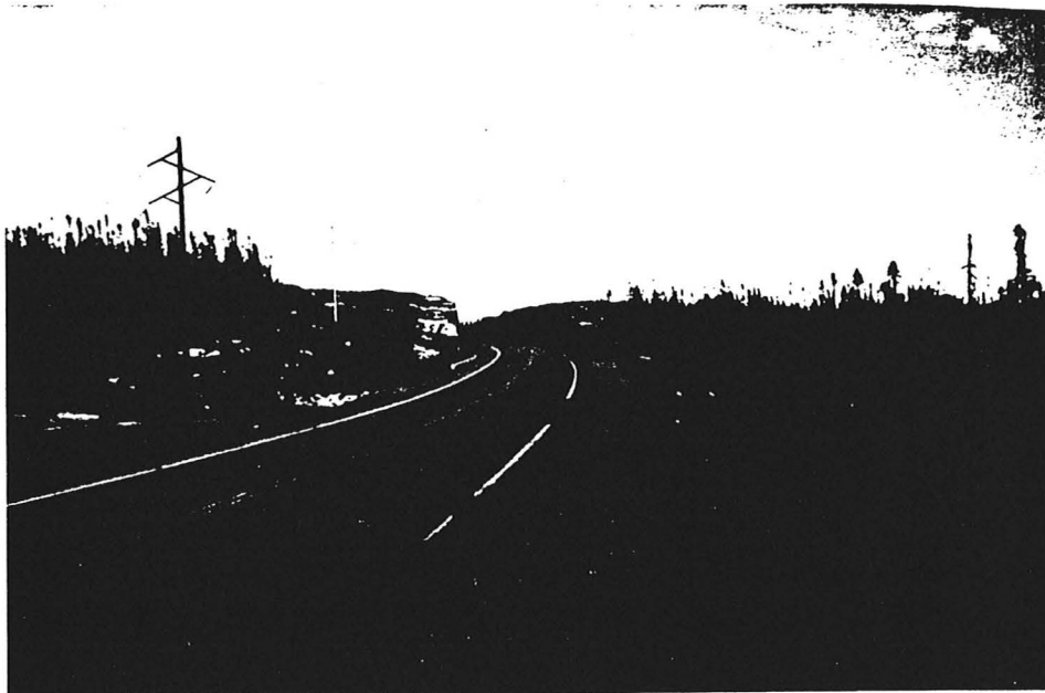
Nouvelle route d'accès reliant la route 148 entre Sept-Îles et Port-Cartier à la centrale SM-3.