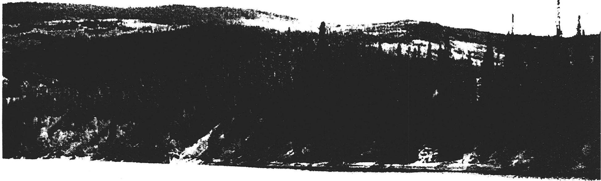
Photo F4 - 15 Rive droite, km 51,8