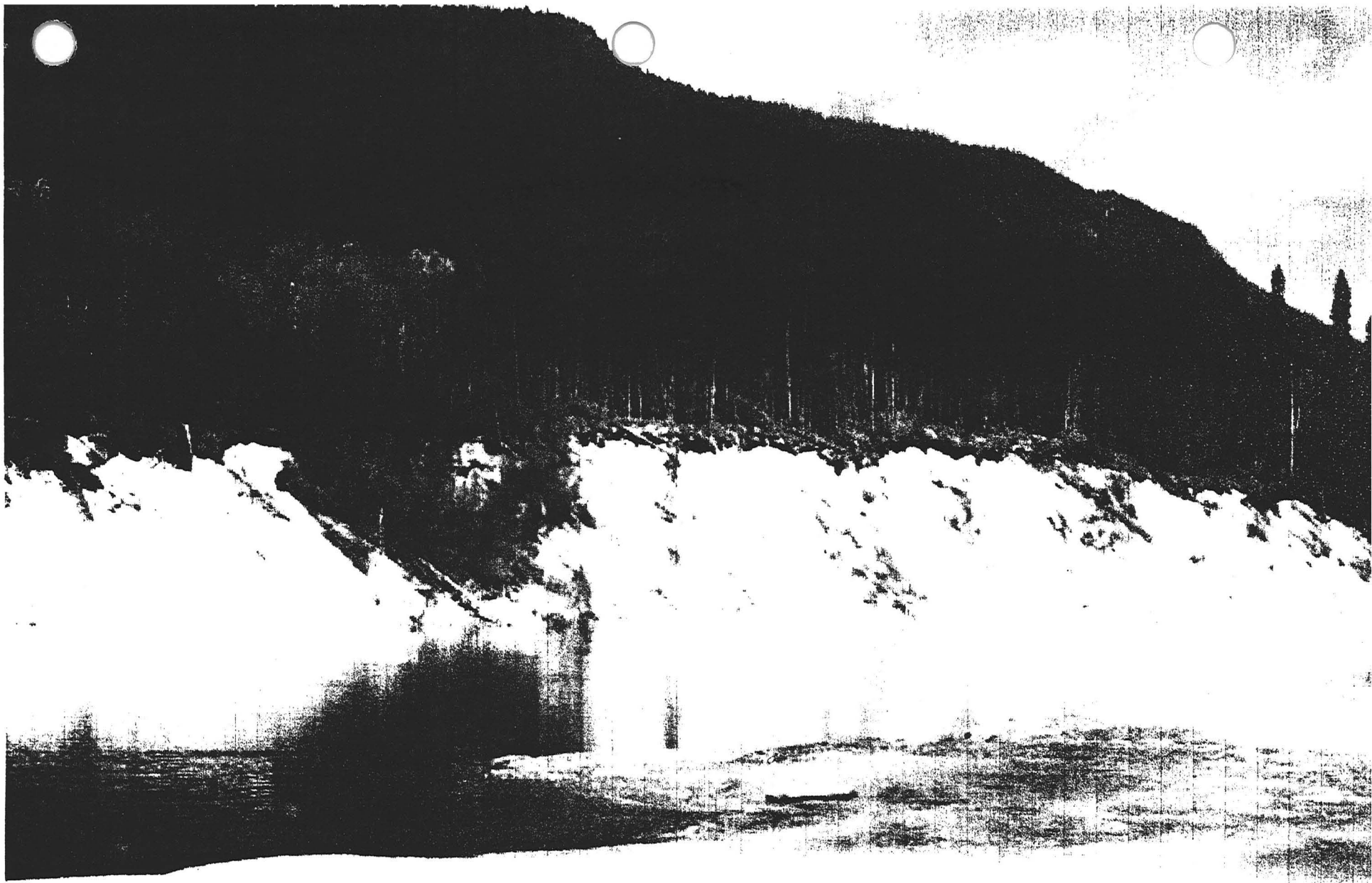
Rive droite, km 45,5