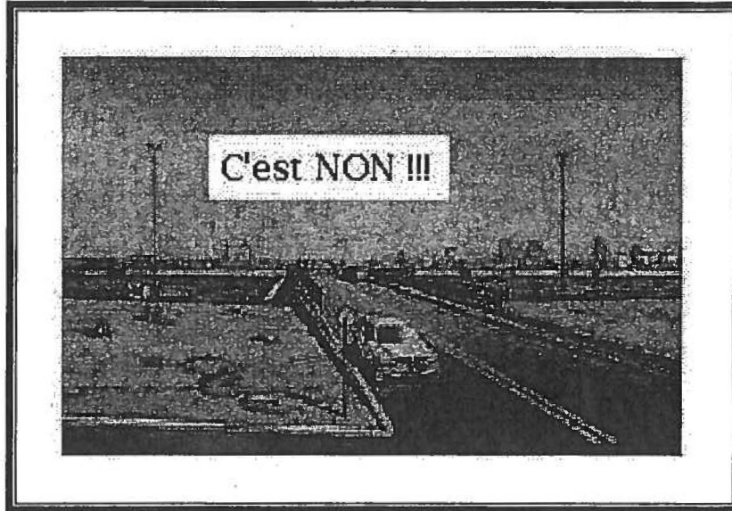
Tracé option Nord (132)

Vous remerciant pour l'attention que vous porterez au présent mémoire, nous vous prions d'agréer, madame la présidente, monsieur le commissaire, l'expression de nos sentiments les plus distingués.