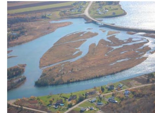
Table de concertation du littoral de Bonaventure 180, avenue Beauséjour 418-534-1818 tclbonaventure@globetrotter.net