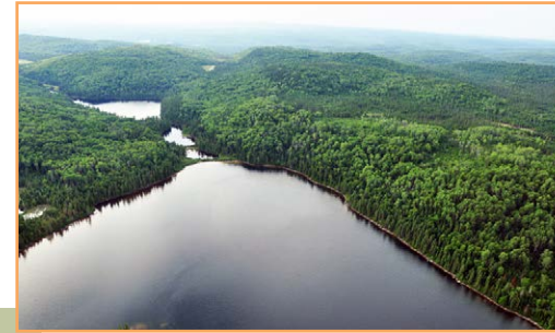
Pointe nord du lac des Trois Caribous avec, en arrière-plan, le lac du Faiseur de Pluie (A. R. Bouchard, MELCC)

** Sauf si le ministre de l'Environnement et de la Lutte contre les changements climatiques a donné son autorisation.