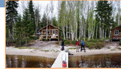
Infrastructures d'accueil de la Sépaq sur les rives du lac Brûlé