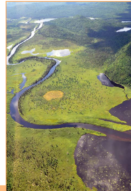
La rivière Métabetchouane et ses milieux humides