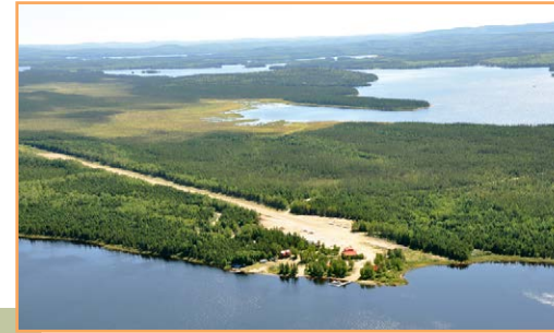
La pourvoirie Escapade et sa piste d'atterrissage

** Sauf si le ministre de l'Environnement et de la Lutte contre les changements climatiques a donné son autorisation.