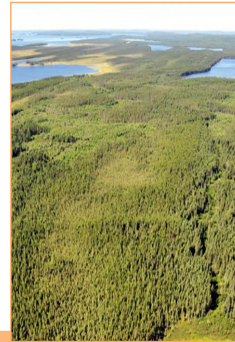
le lac Tobie est entouré de tourbières et de forêts peu productives (A. R. Bouchard, MELCC)