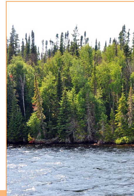
Végétation riveraine typique (A. R. Bouchard, MELCC)

Les aires protégées au Québec : Un héritage pour la vie