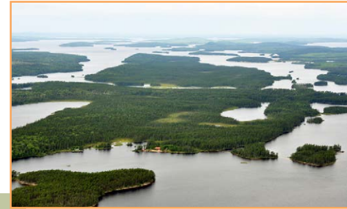
Les îles les plus à l'est

** Sauf si le ministre de l'Environnement et de la Lutte contre les changements climatiques a donné son autorisation.