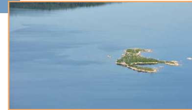
L'île Steamboat dans le lac Wayagamac (A. R. Bouchard, MELCC)