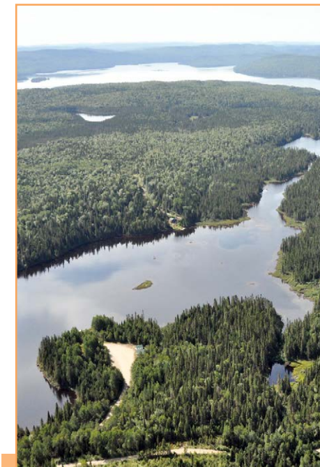
Le Grand lac Caribou