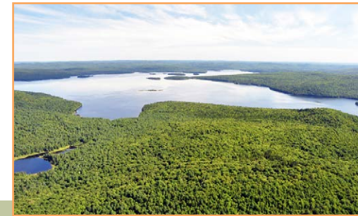
Le lac Wayagamac (vue du sud-ouest)

** Sauf si le ministre de l'Environnement et de la Lutte contre les changements climatiques a donné son autorisation.