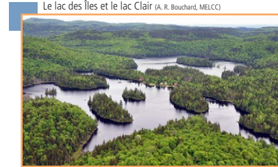
Le lac des Îles et le lac Clair