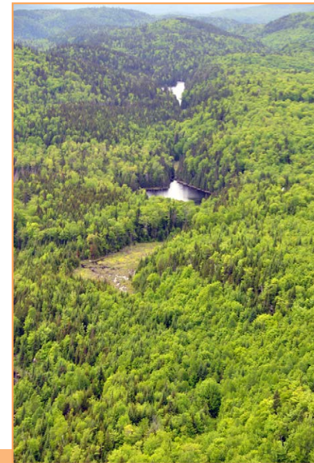
Secteur du lac Paquet