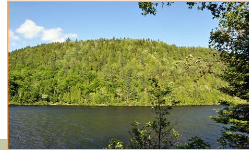
Le lac Roberge, en bordure de la route 159

** Sauf si le ministre de l'Environnement et de la Lutte contre les changements climatiques a donné son autorisation.