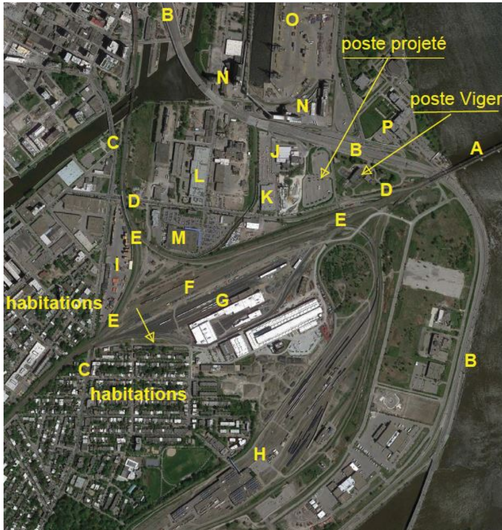
Figure 3-1 : Environnement du site retenu pour le poste des Irlandais projeté