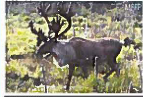
Caribou des bois mâle