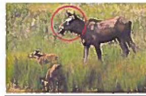
Femelle orignal et ses petits

Longue tête de forme rectangulaire avec nez bulbeux chez l' ORIGNAL