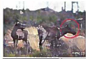
Femelle caribou et son petit

Petite tête de forme triangulaire chez le CARIBOU