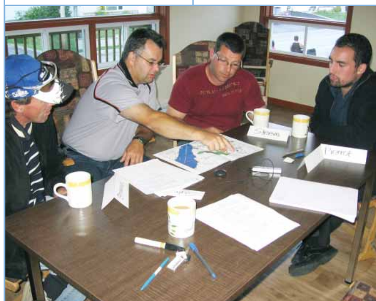
Le principe du groupe d'échange (de l'anglais « Focus Group ») permet d'obtenir un cliché représentatif de la vision que partagent les membres de chaque segment de la Première Nation. Ici, un groupe composé d'hommes de la communauté.