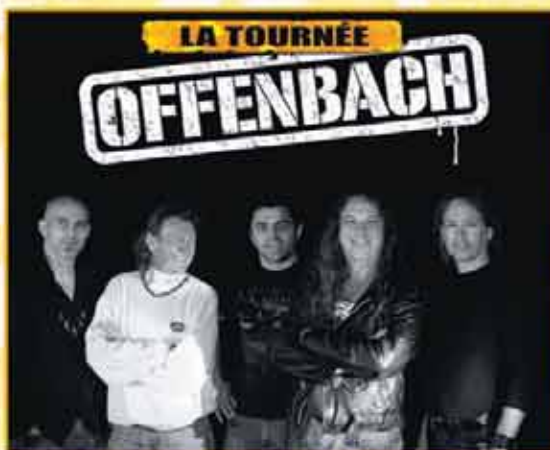
21 h 30 Offenbach