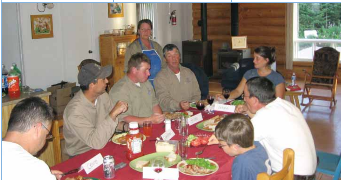
Il va de soi que le point de vue des travailleurs en forêt a été particulièrement utile à la réalisation de cette étude, étant donné la position privilégiée qu'ils occupent sur le territoire.