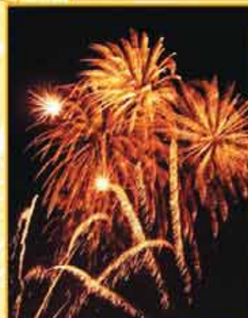
23 h Feux d'artifice