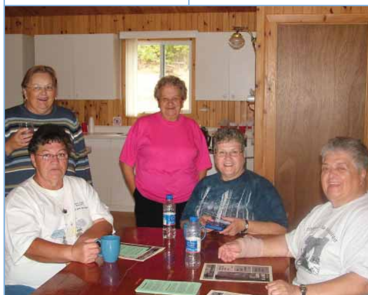
Un des groupes les plus intéressants par son enthousiasme et son intérêt pour le maintien de la culture et des traditions innues : celui des aînés dont le dynamisme et l'implication vis-à-vis les principaux enjeux à l'égard du territoire se sont clairement manifestés.