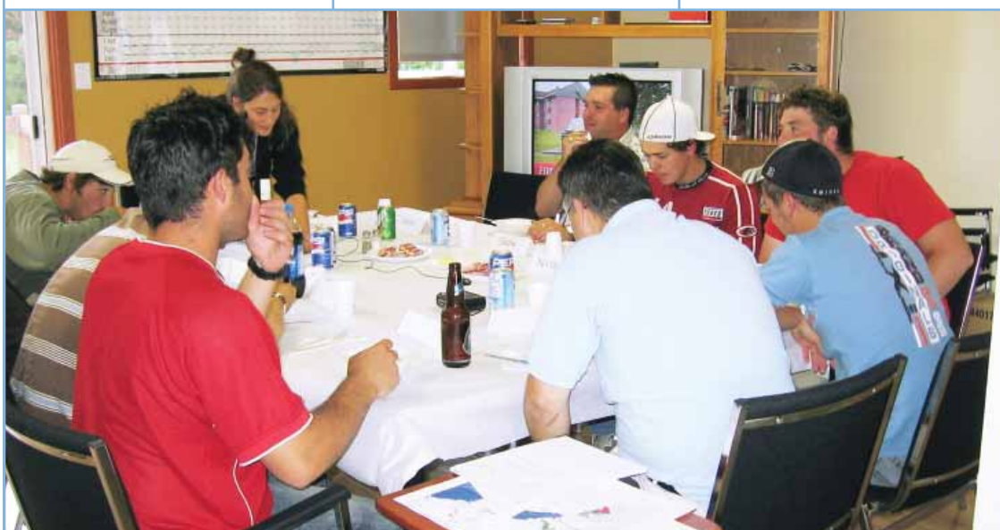
L'échange avec les jeunes a été particulièrement animé et encourageant, en ce sens qu'on découvre chez eux une volonté de maintenir le lien avec le nitassinan d'Essipit.