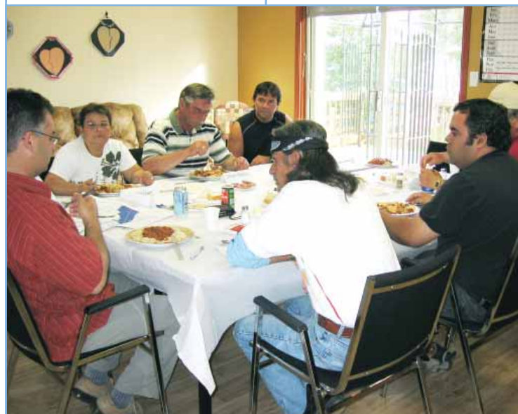
Les utilisateurs du territoire avaient également beaucoup à dire puisque ce sont eux qui maintiennent bien vivant le principe d'Innu Aitun en pratiquant la chasse, la pêche et le piégeage sur le nitassinan.