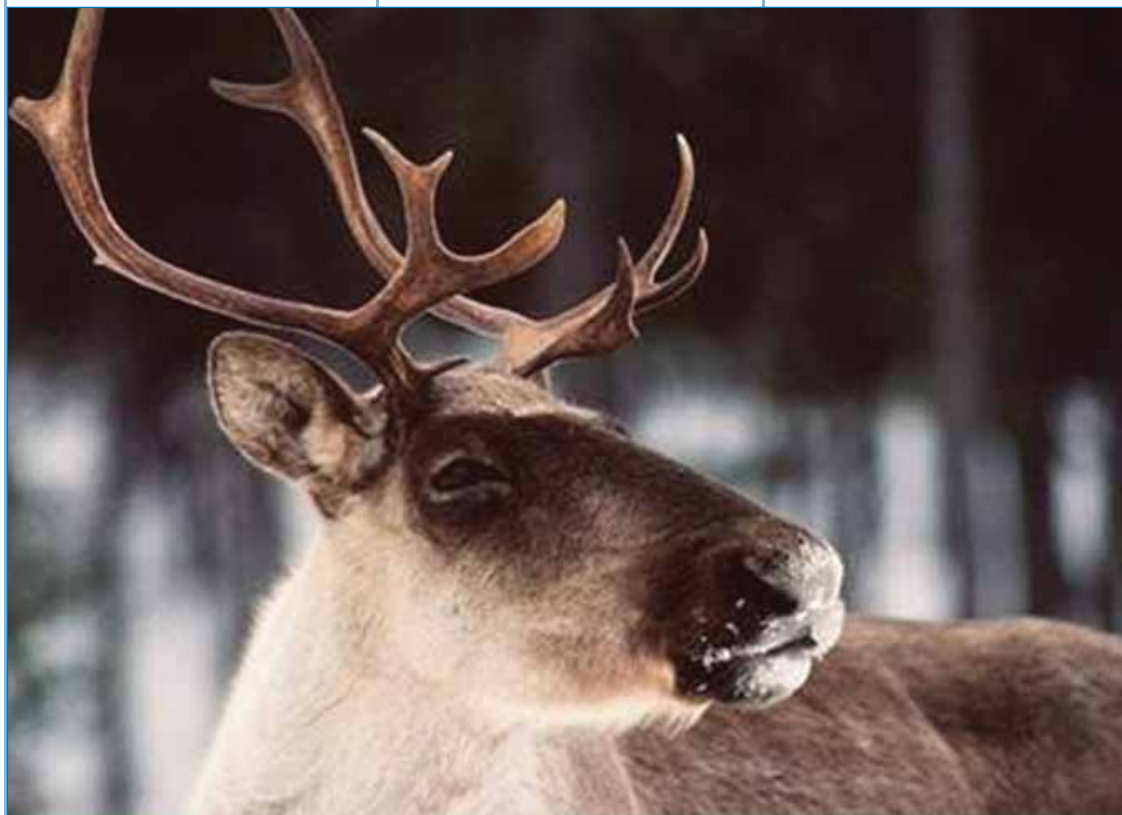
C'est dans le cadre de son partenariat avec la Première Nation d'Essipit, qu'une équipe de chercheurs de l'Université du Québec à Rimouski (UQAR) nous a fait part de certaines découvertes relatives à la survie du caribou des bois dans nos régions.

Selon toute probabilité, cela serait dû à la fidélité de l'animal pour des zones où il a déjà séjourné. Il est en effet reconnu qu'un territoire fraîchement récolté, procure au caribou une abondance de pousses fraîches