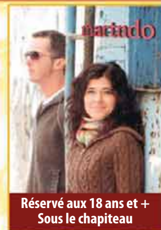
23 h 30 Le duo Mart'n Do

Réservé aux 18 ans et + Sous le chapiteau