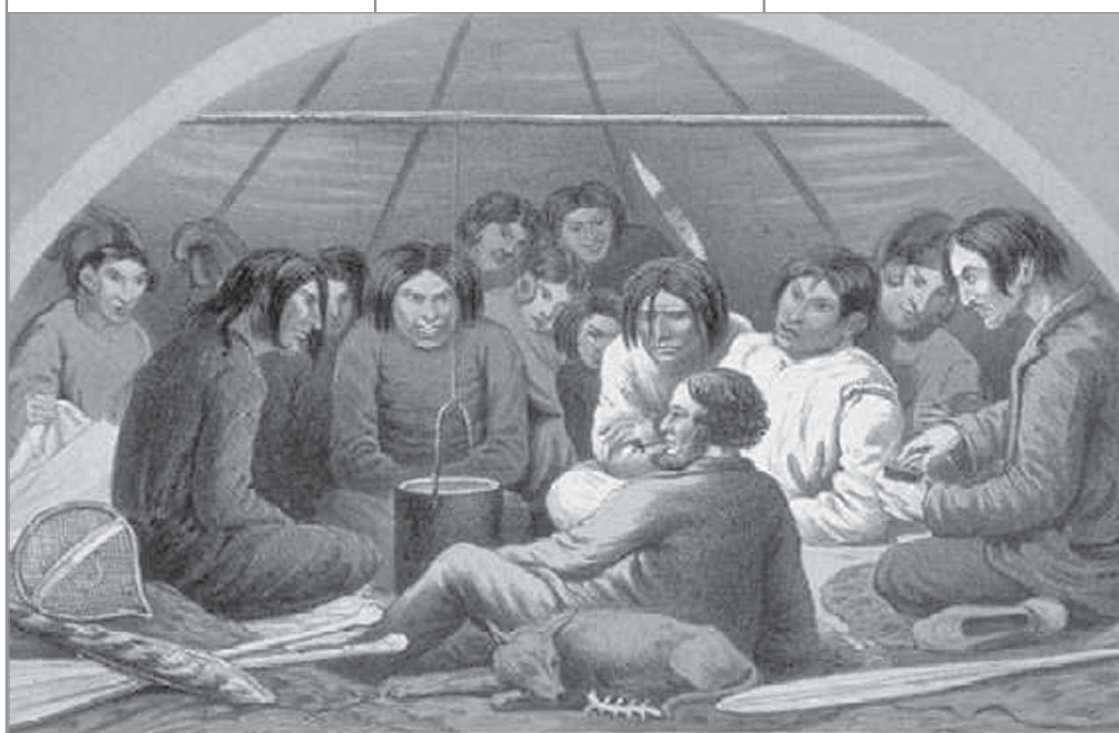
Les rencontres se sont déroulées selon le principe traditionnel voulant que tous soient réunis en cercle, de manière à ce qu'il n'y ait pas de EUX et NOUS, mais plutôt une communauté d'échange composée de gens égaux et responsables.

C'est ainsi que nous sommes parvenus à extraire la majorité