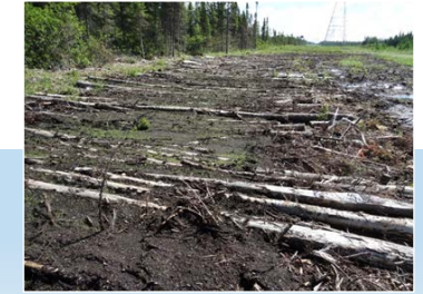
Réaménagement (< 1 an)