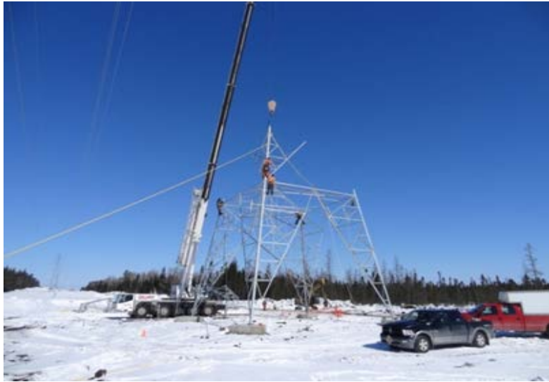
Photo.6: Aire de travail sur sol gelé, projet de la ligne Figury-Palmarolle