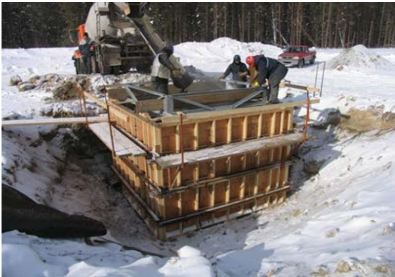
Photo.5: Construction d'une fondation en béton sur sol gelé, projet de la ligne Chénier-Outaouais