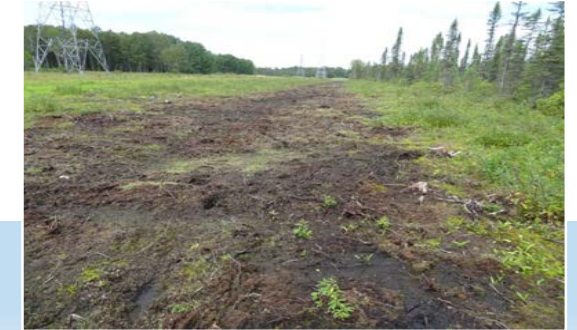
Réaménagement (< 1 an)