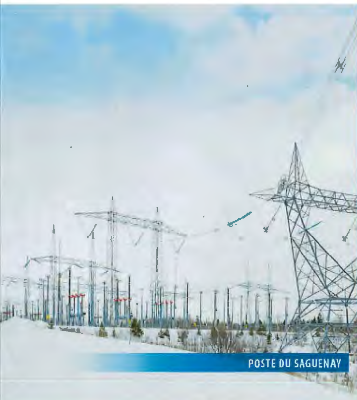
POSTE DU SAGUENAY